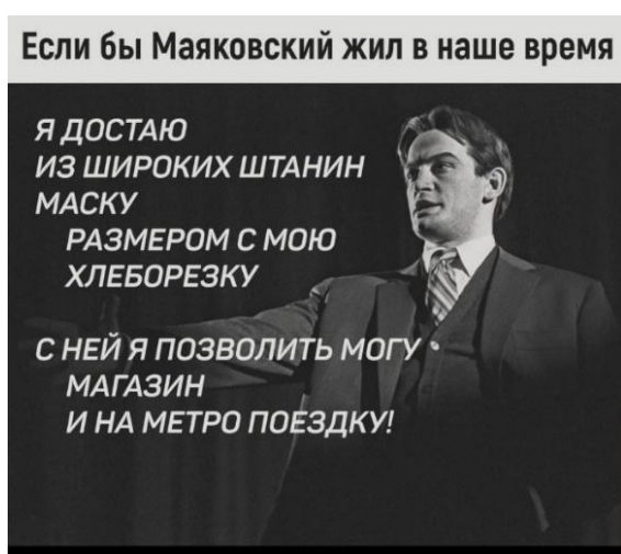
Рисунок 8 – Если бы Маяковский

Например, текстовое сопровождение приведенных ниже поликодовых текстов (Рис.8 и 9) оформлено реминисцентной рифмой В. Маяковского и коррелирует с актуальным сообщению контекстом (Если бы Маяковский, 2023; Закончился месяц, 2023).