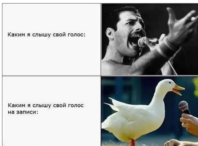
Рисунок 6 – Каким я слышу

КТО-ТО: КАРТИНОК СО ЗВУКОМ НЕ БЫВАЕТ! Я: *ПОКАЗЫВАЮ КАРТИНКУ*