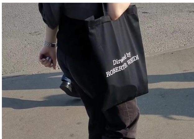
Рисунок 3 – Сумка не издает музыку