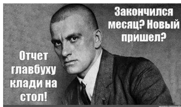
Рисунок 9 – Закончился месяц?