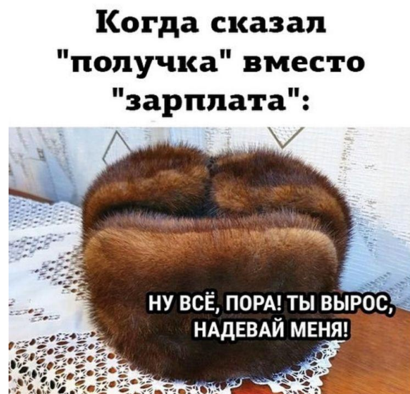
Рисунок 11 – Когда сказал получка

Так, например, образ так называемой «пыжиковой шапки» приобрел значение визуального репрезентанта архаичного словоупотребления. Интернет-