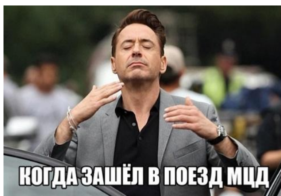
Рисунок 5 – Когда зашел в поезд МЖД

– ольфакторный тип, функциональные смыслы которого включают некоторую ароматическую композицию, актуализируется аллюзиями, модифицированными цитатами и визуальными образами (например, надпись на Рис. 5 «Когда зашел в поезд МЖД» и прецедентное изображение Р. Дауни мл., приблизившего руки к лицу и закрывшего глаза в предвосхищении удовольствия).