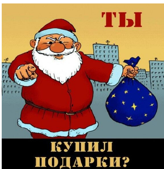
Рисунок 1 – Ты купил подарки?

и жестом руки. Вербальная часть сообщения оформлена реминисцентным квестивом: «Ты купил подарки?», сохраняющим иллюкцию вопроса-обращения. Бóльшую степень сохранения визуальных элементов образа-прототипа наблюдаем на Рис. 2, изоморфно воспроизводящим визуальный код плаката «Что ты сделал для воздушного флота?» (1925), выпущенный «Обществом друзей воздушного флота СССР» (ОДВФ), и содержащим модифицированный вербальный код «Ты уже записался на гулянки?» (Ты уже записался, 2025).