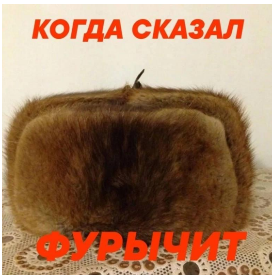
Рисунок 10 – Когда сказал фурычит

Прецедентность культурных знаков опосредована не столько референцией к индивидуальному субъекту или объекту, сколько контекстом эпохи и представлением об определенном культурном феномене и аксиологических в интеллектуальном и эмоциональном отношении ассоциаций с ним связанных. Прецедентные культурные знаки могут приобретать новые оценочные значения и транслировать функциональные смыслы в рамках закрепившихся моделей инкодирования.