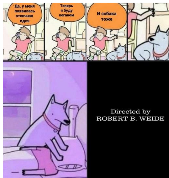
Рисунок 4 – У меня появилась идея

Вербальный компонент семиотически осложненного текста («Сумка не издает музыку говорили они:»), интродуцирующий пример, оформлен с нарушением лексической коллокации («издавать музыку» вместо «издавать