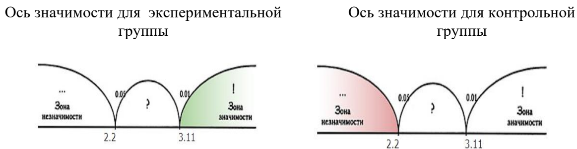
Рисунок 3 – Показатель эмпирического значения по оси значимости для экспериментальной и контрольной группы

На рисунке 3 отображены оси значимости для групп – участников эксперимента.