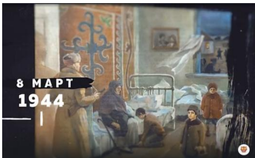
Рисунок 1 – кадр из фильма «Чтобы помнили» (2020)

Аналогичным образом, следующий кадр (Рисунок 2) содержит лишь изображение деревянного эшелона поезда с разбросанными рядом на траве чемоданами, в кадре имеется также изображение какого-то документа, однако, текст его нельзя разобрать, поэтому его наличие не несёт ни когнитивной, ни эмоциональной информации, хотя имеет эстетическую ценность. В центральной области кадра имеется надпись « Терсликсиз азап чекгенле » (Безвинно были угнетены (перевод автора – А.А.)). Ни изображение, ни имеющаяся в кадре фраза по отдельности не представляют информационной или эмоциональной ценности, объединение в одном кадре данного изображения с известной надписью помогает зрителю собрать всё в единую картину, благодаря интегрированному анализу визуального и вербального компонентов кадра.